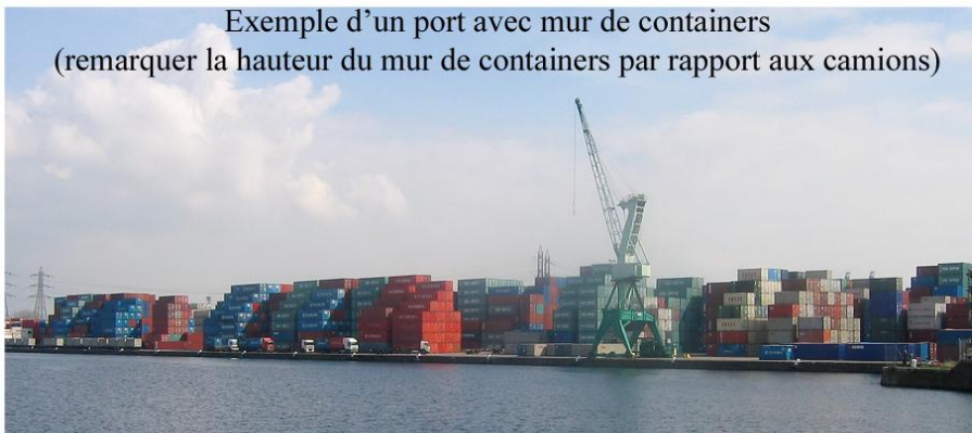
Exemple d'un port avec mur de containers (remarquer la hauteur du mur de containers par rapport aux camions)

CO.P.R.A. 184 BP 30035 ERAGNY-sur-Oise 95611 CERGY Cedex http://www.copra184.org E-mail : contact@copra184.org